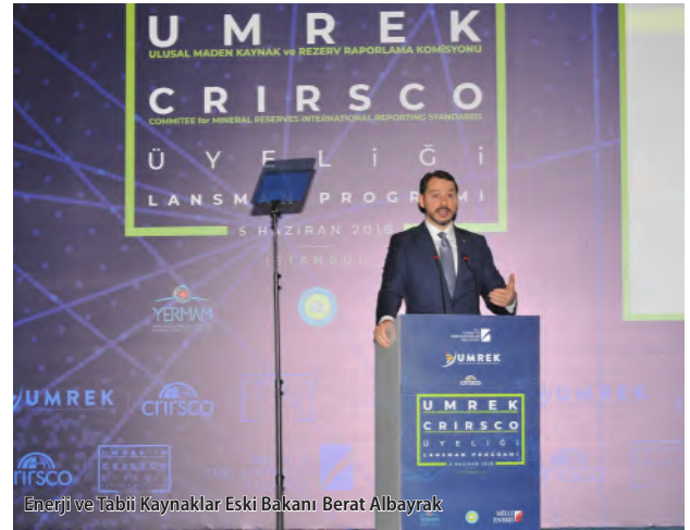
Enerji ve Tabii Kaynaklar Eski Bakanı Berat Albayrak

"CRIRSCO üyeliğiyle beraber, maden sahalarımızda yapılan arama ve işletme faaliyetlerine ait sondaj, analiz, test ve her türlü ça-