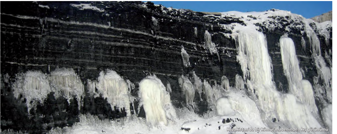
Kazakistan'da bir kömür madeninden kış görünümü

CRIRSCO standartlarında yer alan kodlarda tanımlandığı üzere, "Yetkin Kişiler" tarafından hazırlanan raporların amacı raporlara somutluk, saydamlık ve yetkinliği getirmektir. Ek olarak, "Yetkin Kişiler" mineral kaynak ve rezervlerinin tahminine ulaşmadan önce, birçok noktayı da denetlemek zorunda olduklarından, bu kodlar Yetkin Kişilere önemli sorumluluklar yükler. Dolayısıyla, "Yetkin Kişi Raporları" [YKR - Competent