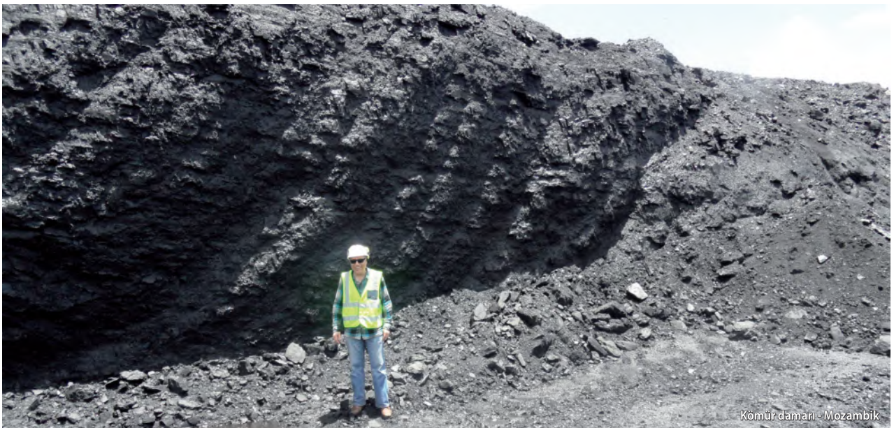
Kömür damarı - Mozambik

Her ne kadar Türkiye’de şu anda kullanılan doğal kaynak ve rezerv sınıflaması 4 başlangıçta önerilen ve farklı felsefeye dayanan sınıflamadan evrime uğrayarak günümüze dek ulaşsa da, yine de ilerisi için olumlu bir adımdır. Ancak var olan sınıflama hala genel anlamda jeolojik temellere dayandığından, CRIRSCO çatısı altında yer alan standartların sahip olduğu ayrıntılardan