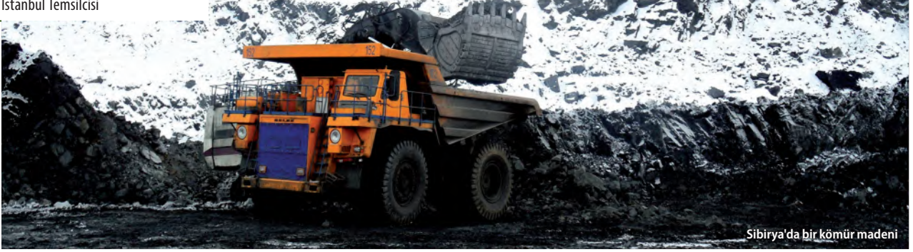
Sibirya'da bir kömür madeni

DMT Consulting Limited İstanbul Temsilcisi